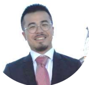
Contribution de Yoann Lin

La Cour d'appel de Paris rappelle d'abord qu'au titre de l'article 1493 du code de procédure civile, « [I]orsque la juridiction annule la sentence arbitrale, elle statue sur le fond dans les missions de l'arbitre, sauf volonté contraire des parties ». Elle retient ensuite que les parties admettent l'existence d'une clause compromissoire désignant la CAIP, de laquelle elle déduit que le Règlement d'arbitrage de la CAIP devait trouver à s'appliquer. Ainsi, elle juge qu' « en application de l'article 31.1 du règlement d'arbitrage de la chambre arbitrale internationale, la cour est incompétente pour statuer sur le litige opposant la société Euro Grains et la Gaec de Bellevue », de sorte qu' « il appartient à la partie la plus diligente de saisir la chambre arbitrale internationale de Paris ». Autrement dit, la Cour considère qu'en consentant à une clause compromissoire désignant une institution d'arbitrage, les parties consentent également à l'application de son règlement d'arbitrage. Ainsi, si ce règlement contient une disposition qui exclut la compétence de la cour d'appel saisie du recours en annulation, alors le consentement au règlement d'arbitrage de l'institution vaut « volonté contraire des parties » au sens de l'article 1493 du code de procédure civile.