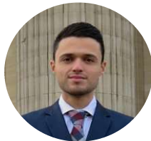
Contribution de Jorge Hidalgo

Dès lors, la cour considère que la clause compromissoire invoquée par Campus ESG est manifestement inapplicable, au sens de l'article 1448, et que par conséquent, le principe compétence-compétence avait été respecté par le jugement rendu en première instance.