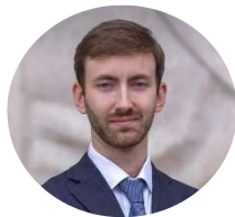
Contribution de Maxime Villeneuve

La Cour poursuit toutefois en émettant l'hypothèse que le droit anglais soit applicable, et se prononce sur la question de savoir si l'Angleterre était le for approprié pour solliciter une anti-suit injunction . La High Court rejette chacun des arguments formulés par la partie sollicitant ladite injonction. Selon elle, le fait que la loi anglaise régisse le contrat entre les parties n'était pas un facteur établissant une connexion suffisante avec le Royaume-Uni. Ne l'a pas convaincue davantage le fait que les juridictions anglaises étaient les seules à pouvoir délivrer des anti-suit injunctions , puisque d'autres remèdes appropriés étaient ouverts devant le juge français. Enfin, la violation de la Convention de New York par la Russie, résultant de sa nouvelle législation permettant aux juridictions russes de se prononcer sur un litige normalement soumis à l'arbitrage, n'était pas non plus un argument permettant à la cour anglaise de se déclarer compétente. In fine , la High Court rejette la demande d' anti-suit injunction formulée par la société G.