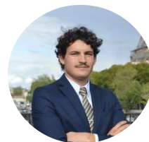
Contribution de Ghais Ghedjati

Par conséquent, le Conseil d'État français rejette le pourvoi formé par les sociétés Ryanair tout en les condamnant à verser au Syndicat Mixte des Aéroports de Charente une somme de 1.500 euros au titre de l'article L. 761-1 du code de justice administrative. Le Conseil d'État met ainsi un terme à la saga SMAC qui aura duré plus de dix ans.