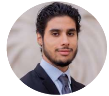
Contribution d'Adel Al Beldjilali-Bekkairi

Cette prise de position du juge anglais fait écho à celle adoptée précédemment par les juridictions étrangères. Par voie de conséquence, il est probable que la Cour suprême d'Angleterre et du Pays de Galles, ait à se prononcer sur la validité de la sentence. La présente décision vient très certainement prédire une solution favorable aux demandeurs.