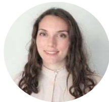
Contribution de Romi Grumberg

Ainsi, la Cour d'appel de Paris refuse donc de faire droit à la demande de sursis à statuer des actionnaires de CCCC Algérie.