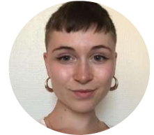
Contribution de Louise Nicot

judiciaires s'élevant à 160.000 CHF, et à verser aux intimées, créancières solidaires, une indemnité de 200.000 CHF., ainsi qu'à deux des défendeurs une indemnité de 200.000 CHF chacun.